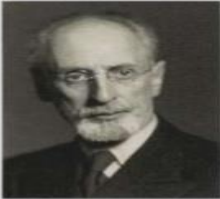
Eli Hecksher (1879-1952) Swedish economist