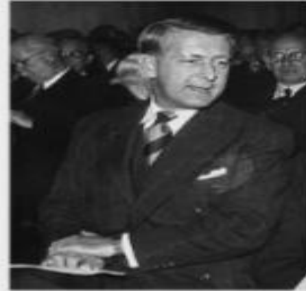
Bertil Ohlin (1899-1979) Swedish economist and politician